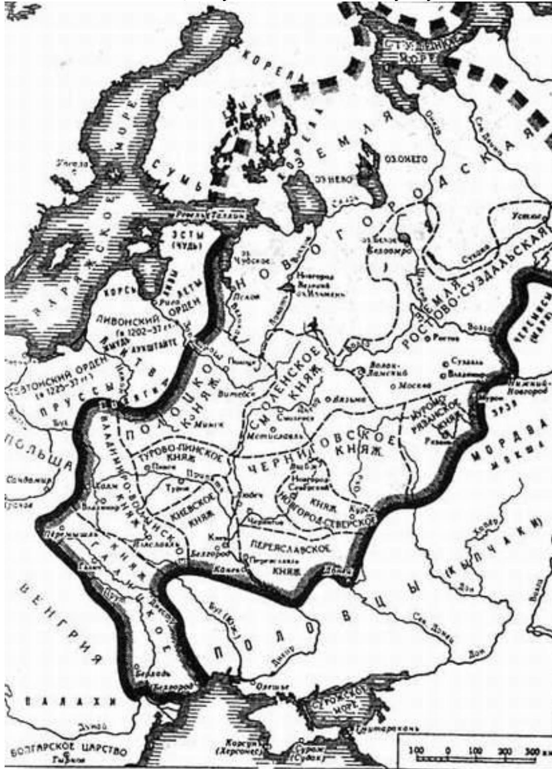
72. Русские княжества в XII в.

Если в старых городах, Ростове и Суздале, князьям приходилось считаться с влиянием сильного боярства, то в молодых центрах - Владимире и Ярославле - они опирались на растущие городские сословия, купечество, ремесленников, мелких землевладельцев, получивших землю за службу князю.